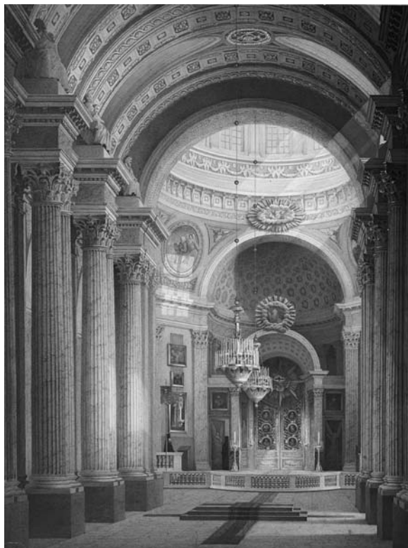
А. Р. Лупанов. Вид центрального нефа собора. 1862 (?).

б) в куполе, в сводах, арках и по стенам все арабески, розеты, фигуры, головки переписать, все вновь по прежде существующим рисункам и коле-