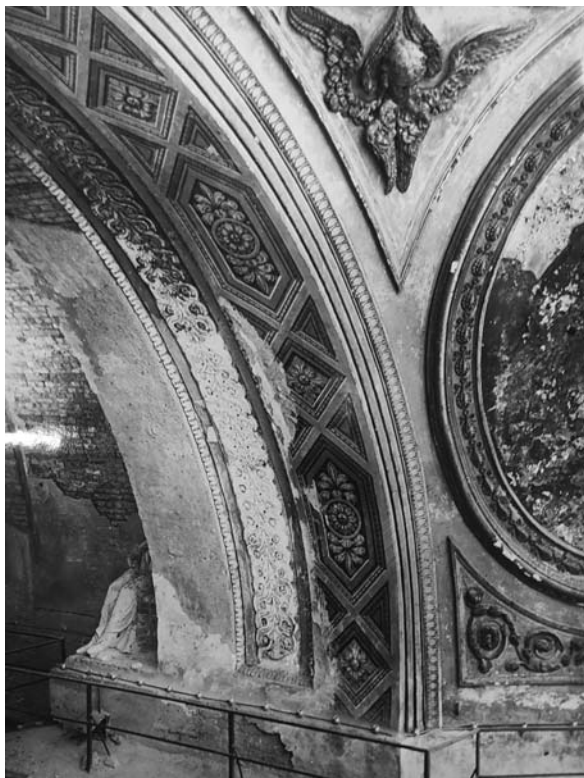
Западная подпружная арка подкупольной части и северо-западный парус Свято-Троицкого собора до реставрации. 1957. Материалы экспозиции, посвященной реставрации собора. 1960-е гг. Публикуется впервые

В феврале 1957 г. была проведена техническая экспертиза, которая установила «исключительно плохое состояние» большинства элементов наружной и внутренней отделки собора, разрушения каменных конструкций. Штукатурная отделка фасадов была утрачена на большой площади. Скульптурное убранство было практически полностью разруше-