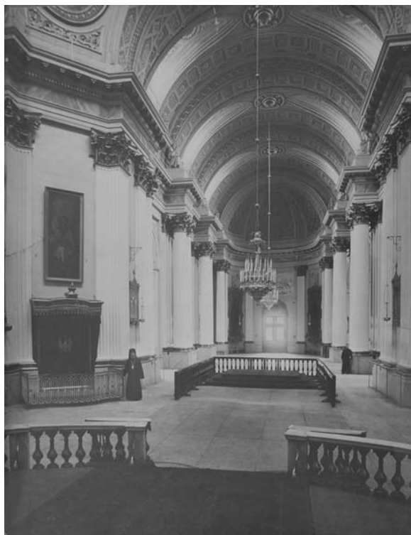
Средний неф Свято-Троицкого собора. 1910-е гг.

В Свято-Троицком соборе богослужения продолжались и после 1917 г. 2 декабря 1924 г. представите-