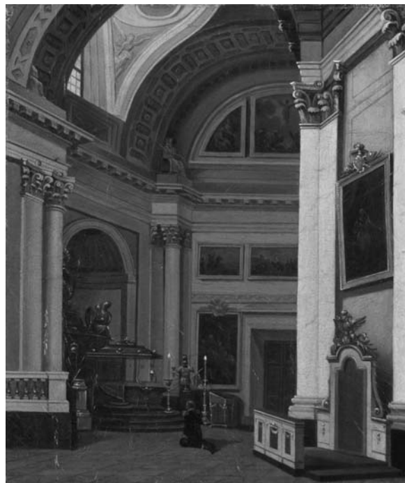
Г. Г. Чернецов. Последние минуты пребывания императора Александра I в Санкт-Петербурге 1 сентября 1825 г. 1827. Бумага, наклеенная на холст, 27,5×23 см. ГЭ (ЭРЖ-2203)

Выполненная по проекту архитектора Д. Кваренги внутренняя роспись Троицкого собора заменила собой первоначальную, сделанную живописцем Федором Даниловым, и явилась вторым слоем