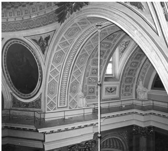
Вид южной части трансепта Свято-Троицкого собора после реставрации. 1960-е. Материалы экспозиции, посвященной реставрации собора. 1960-е гг. Публикуется впервые

Совокупность полученных данных дала нам право и возможность подойти вплотную к реконструк-